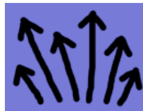
manifestime të shumta të perëndive dhe perëndeshave

Pjesa më e madhe e Hinduve adhurojnë paraqitje të pafundme të njëqenësisë përfundimtare (Brahman) nëpërmjet një shumice perëndish dhe perëndeshash, mbi 300,000 prej tyre. Këto manifestime të shumta të perëndive dhe perëndeshave mishërohen brenda idhujve, tempujve, guruve, lumenjve, kafshëve, etj.