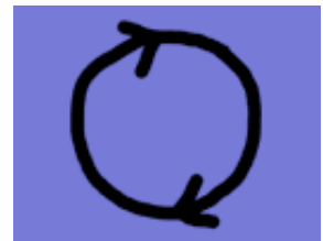
një person në Epokën e Re e shikon veten si Perëndia

Epoka e Re reklamon zhvillimin e fuqisë dhe hyjnitetit së personit. Kur i referohet Perëndisë, një ndjekës i Epokës së Re nuk e ka fjalën për një Perëndi transcendent dhe personal që krijoi universin, por e ka fjalën për një vetëdije më të lartë brenda vetes. Një person në Epokën e Re e shikon veten si Perëndia, kozmosi, universi. Në fakt, çdo gjë që personi shikon, dëgjon, ndjen apo imagjinon duhet konsideruar hyjnore.