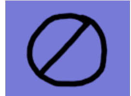
Budistët nuk adhurojnë ndonjë perëndi

Budistët nuk adhurojnë ndonjë perëndi. Njerëzit jashtë Budizmit shpesh mendojnë se Budistët adhurojnë Budën. Megjithatë, Buda (Siddhartha Gautama) kurrë nuk pretendoi se ishte hyjnor, por shihet prej tyre si ai që arriti atë që ata po përpiqen të arrijnë, dhe që është ndriçimi shpirtëror dhe, me të, çlirim nga cikli i vazhdueshëm i jetës dhe vdekjes. Shumica e Budistëve besojnë se një person ka rilindje të panumërta, të cilat në mënyrë të pashmangshme kanë brenda edhe vuajtje. Një Budist përpiqet t'iu japë fund këtyre rilindjeve. Budistët besojnë se janë dëshirat, mospëlqimet dhe iluzionet e personit që i shkaktojnë këto rilindje. Prandaj, qëllimi i një Budisti është të pastrojë zemrën e vet dhe të heqë dorë nga gjithë dëshirat sensuale dhe dashuria ndaj vetes.