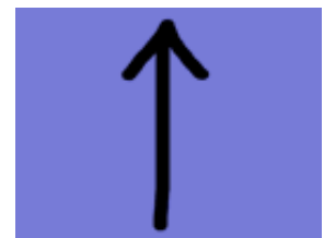
Myslimanët besojnë se ka një perëndi të gjithëfuqishëm dhe transcendent

Myslimanët besojnë se ka një perëndi të gjithëfuqishëm të quajtur Allah, i cili është pafundësisht superior dhe transcendent ndaj njerëzimit. Allahu shihet si krijuesi i universit dhe burimi i gjithë të mirës dhe të keqes. Çdo gjë që ndodh është vullneti i Allahut. Ai është një gjykatës i fuqishëm dhe i rreptë, që do të jetë i mëshirshëm ndaj ndjekësve të Tij sipas të mirave që kanë bërë në jetë dhe devotshmërisë fetare. Marrëdhënia e një ndjekësi me Allahun është si një shërbëtor i Allahut.